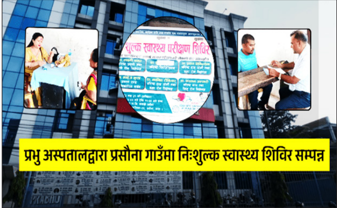
प्रभु अस्पतालद्वारा प्रसौना गाउँमा निःशुल्क स्वास्थ्य शिविर सम्पन्न