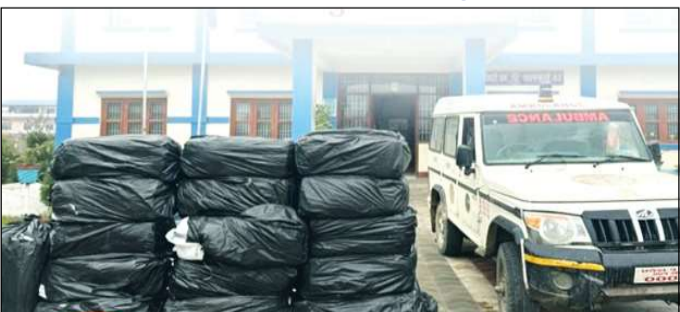
वीरगञ्ज, १४ पुस ।

बिरामी बोक्ने एम्बुलेन्सको दुरुपयोग गरी गाँजा तस्करी गरिरहेको अवस्थामा मोरङ