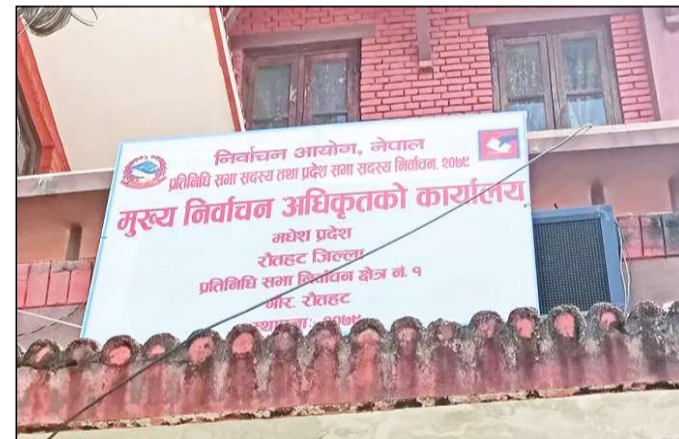
रौतहट, १४ पुस ।

आगामी फागुन २१ गते हुने प्रतिनिधिसभा निर्वाचनका लागि रौतहट जिल्लामा निर्वाचन तयारी तीव्र पारिएको छ । बढ्दो मतदाता सङ्ख्यालाई मध्यनजर गर्दै जिल्ला निर्वाचन कार्यालयले यसपटक मतदानस्थल र केन्द्रहरू थप गरेको छ । जिल्ला निर्वाचन कार्यालय रौतहटका प्रमुख छोटेलाल