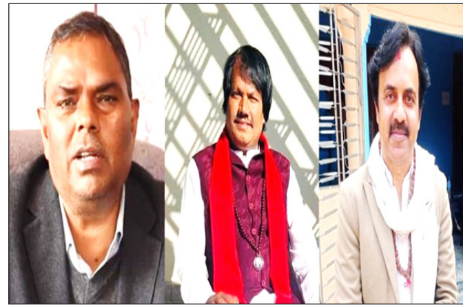
जनकपुर, १० माघ ।

फागुन २१ मा हुने प्रतिनिधिसभा निर्वाचनको तयारीमा सप्तरी जिल्लामा चुनावी सरगर्मी बढेको छ । यसपटक सप्तरीका चारवटै निर्वाचन क्षेत्रमा विभिन्न दलका नयाँ र पुराना नेता, साथै राष्ट्रिय अध्यक्षहरूको प्रत्यक्ष प्रतिस्पर्धा देखिन थालेको छ । क्षेत्र नम्बर २ बाट जनमत पार्टीका अध्यक्ष डा. सिके राउत र जनअधिकार पार्टीका अध्यक्ष डा. शरतसिंह यादव, र क्षेत्र नम्बर ३ बाट जनता समाजवादी पार्टी नेपालका अध्यक्ष उपेन्द्र यादव उम्मेदवार बनेका छन् । यसअघि