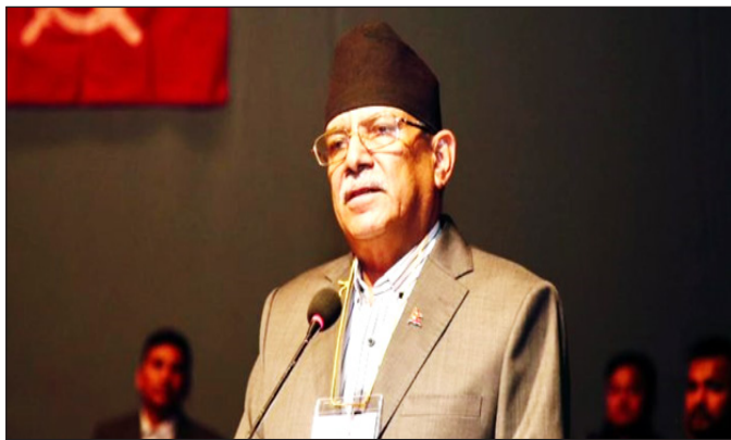
काठमाडौं, १० माघ ।