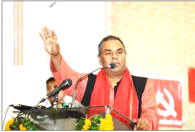
जनकपुर, १० माघ ।

जनता समाजवादी पार्टी (जसपा) नेपालका अध्यक्ष उपेन्द्र यादवका लागि आगामी प्रतिनिधिसभा निर्वाचन सप्तरी क्षेत्र नम्बर-३ मा कडा परीक्षा बन्ने देखिएको छ । क्षेत्र परिवर्तन गर्दै आएका यादवले यसपटक तुलनात्मक रूपमा सुरक्षित क्षेत्र खोज्दै सप्तरी-३ बाट उम्मेदवारी दर्ता गराएका छन् र चुनावी प्रचारसमेत तीव्र बनाएका छन् । २०७४ को निर्वाचनमा सप्तरी-२ बाट विजयी भएका यादव २०७९ मा सोही क्षेत्रबाट पराजित भएका थिए । त्यसपछि बारा-२ को उपनिर्वाचन जितेर संसद पुगेका उनी यसपटक पुनः सप्तरी फर्किएका हुन् । यद्यपि, सप्तरी-३ मा जसपा