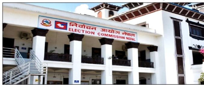
सर्लाही, १४ फागुन ।

फागुन २१ गते हुने प्रतिनिधि सभा सदस्य निर्वाचनका लागि सर्लाही जिल्लामा सुरक्षा उच्च सतर्कतामा राखिएको छ । जिल्लाभर ३१२ मतदानस्थलमध्ये १५८ मतदानस्थललाई अति संवेदनशील र १३१ लाई संवेदनशीलको सूचीमा राखिएको छ । विशेषगरी, सर्लाही क्षेत्र नम्बर ४ मा रहेका सबै ८१ मतदानस्थल अति संवेदनशील सूचीमा परेका छन् । क्षेत्र नम्बर ४ का बलरा, गडैता नगरपालिका र विष्णुपुर तथा रामनगर गाउँपालिका भारतसँग जोडिएको खुला सीमासँग सम्पर्कमा छन् । तर केवल सीमासँग जोडिएको कारण मात्र होइन, निर्धारित मापदण्डको पालना गरौं, ग्रामिण विकासको भियानमा सघाऔं ।