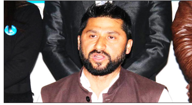
काठमाडौं, २४ फागुन ।