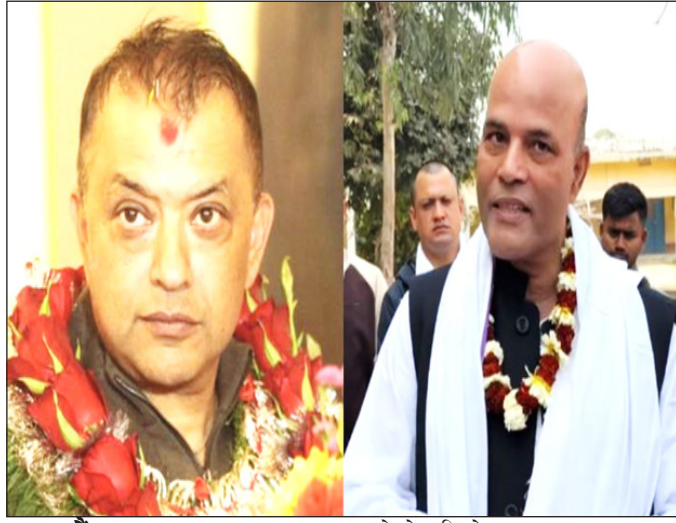
काठमाडौं, २४ फागुन ।