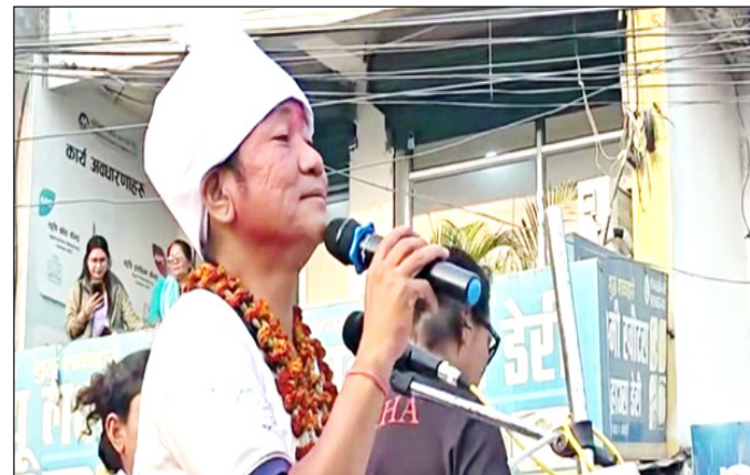
काठमाडौं, २४ फागुन ।

प्रतिनिधिसभा सदस्य निर्वाचन २०८२ अन्तर्गत सुनसरी निर्वाचन क्षेत्र नम्बर-१ को अन्तिम मत परिणाम सार्वजनिक भएको छ । परिणाम अनुसार श्रम संस्कृति