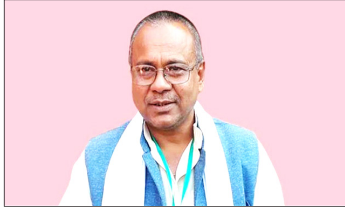
नेपाल पोस्ट संवदाता बीरगन्ज, २८ वैशाख ।