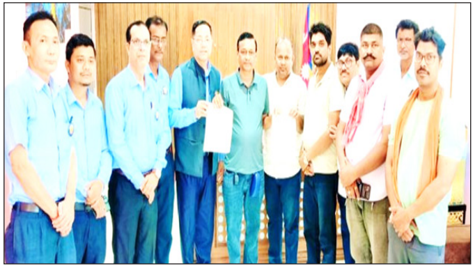
नेपाल पोस्ट संवदाता बीरगन्ज, २८ वैशाख ।

बीरगन्ज महानगरपालिका-१२ स्थित गौतम माध्यमिक विद्यालयमा प्रवेश परीक्षा र भीड व्यवस्थापनका क्रममा उत्पन्न भएको विवाद आपसी छलफलपछि समाधान भएको छ । विद्यालय प्रशासन र अभिभावक पक्षबीच भएको सहमतिपछि घटना मेलमिलापमा टुंगिएको हो । सहमति अनुसार नयाँ शैक्षिक सत्र २०८३ वैशाख