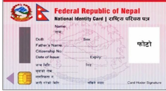
काठमाडौँ, २८ वैशाख ।

राष्ट्रिय परिचयपत्र व्यवस्थापन सूचना प्रणालीमा आएको प्राविधिक खराबीका कारण देशभरका सेवाहरू एक सातादेखि प्रभावित भएका छन् । प्रणाली गत वैशाख २१ गतेदेखि अवरुद्ध भएपछि परिचयपत्रसँग सम्बन्धित अत्यावश्यक सेवाहरू ठप्प भएका