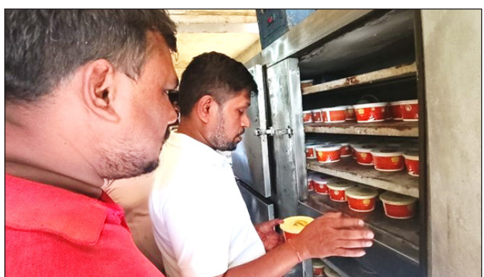
नेपाल पोस्ट संवदाता बीरगन्ज, २८ वैशाख ।

उपभोक्ता हित संरक्षण मञ्चको उजुरीपछि पर्साको पकाहा मैनपुर गाउँपालिका-१, धोरेस्थित कलश मिल्क इन्डस्ट्रिज प्रा.लि. मा अनुगमन टोलीले छापा